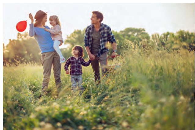
Glückliche Familie in der Natur.