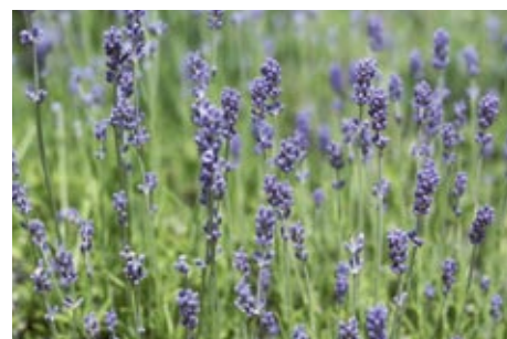
Lavendelduft für einen ruhigen und erholsamen Schlaf