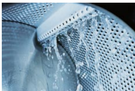
DEHA-Waschmittel zur Beseitigung von Ablagerungen und Gerüchen