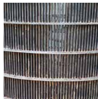
Con TUXON | Com TUXON