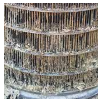
Sin TUXON | Sem TUXON